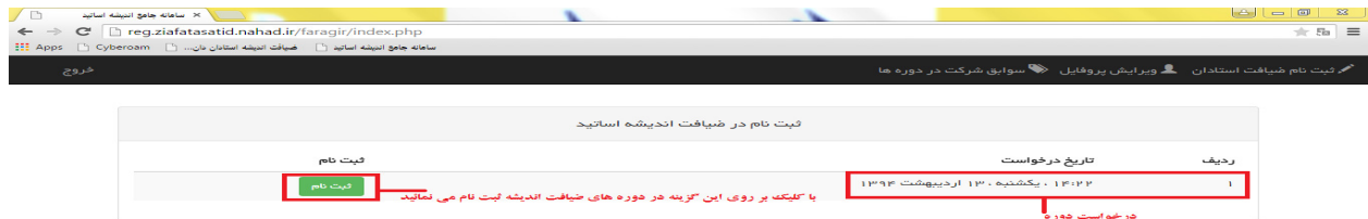
تصویر شماره ۷

پس از ورود به صفحه کاربری خود چنانچه دانشگاه محل تدریس شما درخواست دوره داده باشند می توانید ثبت نام نمائید و در صورتی که درخواست داده نشده باشد این امکان وجود ندارد همچنین می توانید در صفحه کاربری خود مشخصات را ویرایش نماید و همچنین می توانید سوابق شرکت در دوره ها را مشاهده نمایید. (تصویر شماره ۷)