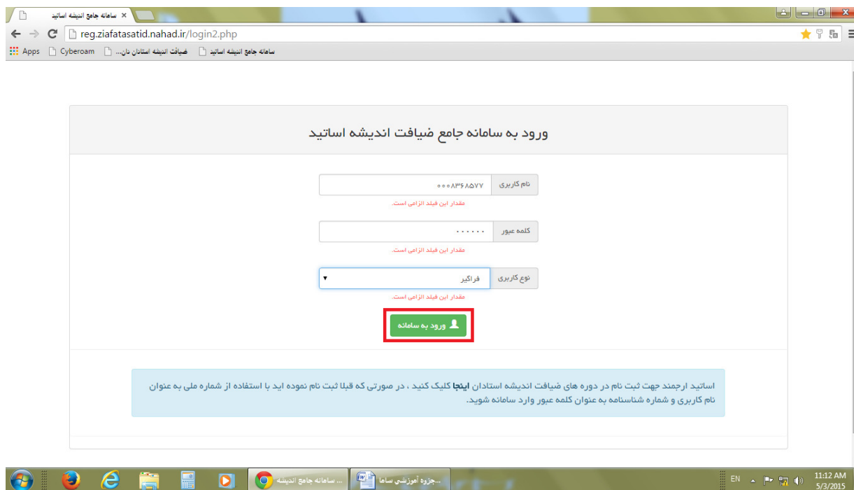
تصویر شماره ۶

پس از دریافت نام کاربری و کلمه عبور به صفحه ورودی سامانه جامع بازگشته و در قسمت نام کاربری کد ملی و در قسمت کلمه عبور شماره شناسنامه خود و در قسمت نوع کاربری گزینه فراگیر را انتخاب نمائید لازم به ذکر است بعد از دریافت نام کاربری و کلمه عبور برای ثبت نام در دوره های ضیافت اندیشه استادان از این طریق اقدام نمائید. (تصویر شماره ۶)