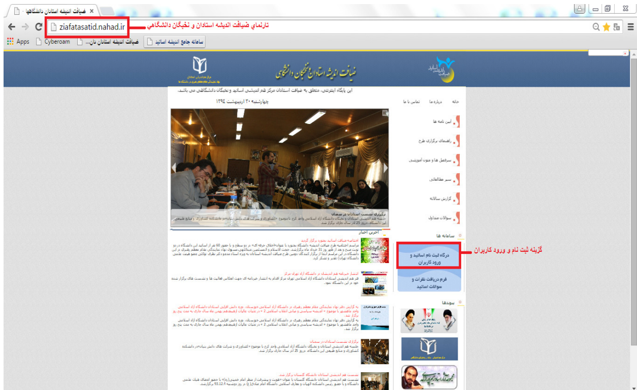
تصویر شماره ۱

جهت ثبت نام در دوره های ضیافت اندیشه استادان و نخبگان دانشگاهی می بایست از طریق تارنمای www.ziafatasatid.nahad.ir ، درگاه ثبت نام اساتید و ورود کاربران را انتخاب نمائید. (تصویر شماره ۱)