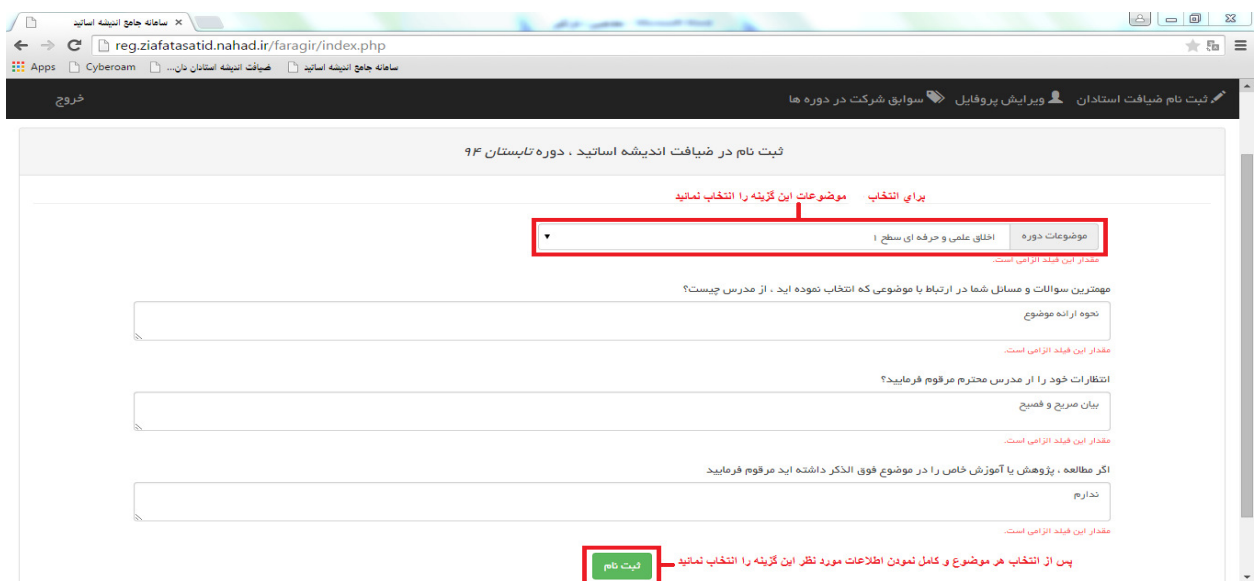
تصویر شماره ۸

پس از انتخاب گزینه ثبت نام وارد صفحه انتخاب موضوع مورد نظر، بیان سوالات و انتظارات می شوید که پس از کامل نمودن این صفحه با انتخاب گزینه ثبت نام مراحل ثبت نام شما در دوره های ضیافت اندیشه استادان انجام می گردد. چنانچه بیش از یک موضوع مورد نظر باشد موضوعات را انتخاب کرده و پس از کامل نمودن اطلاعات هر موضوع گزینه ثبت نام را انتخاب می نمائید (تصاویر شماره ۸ و ۹)